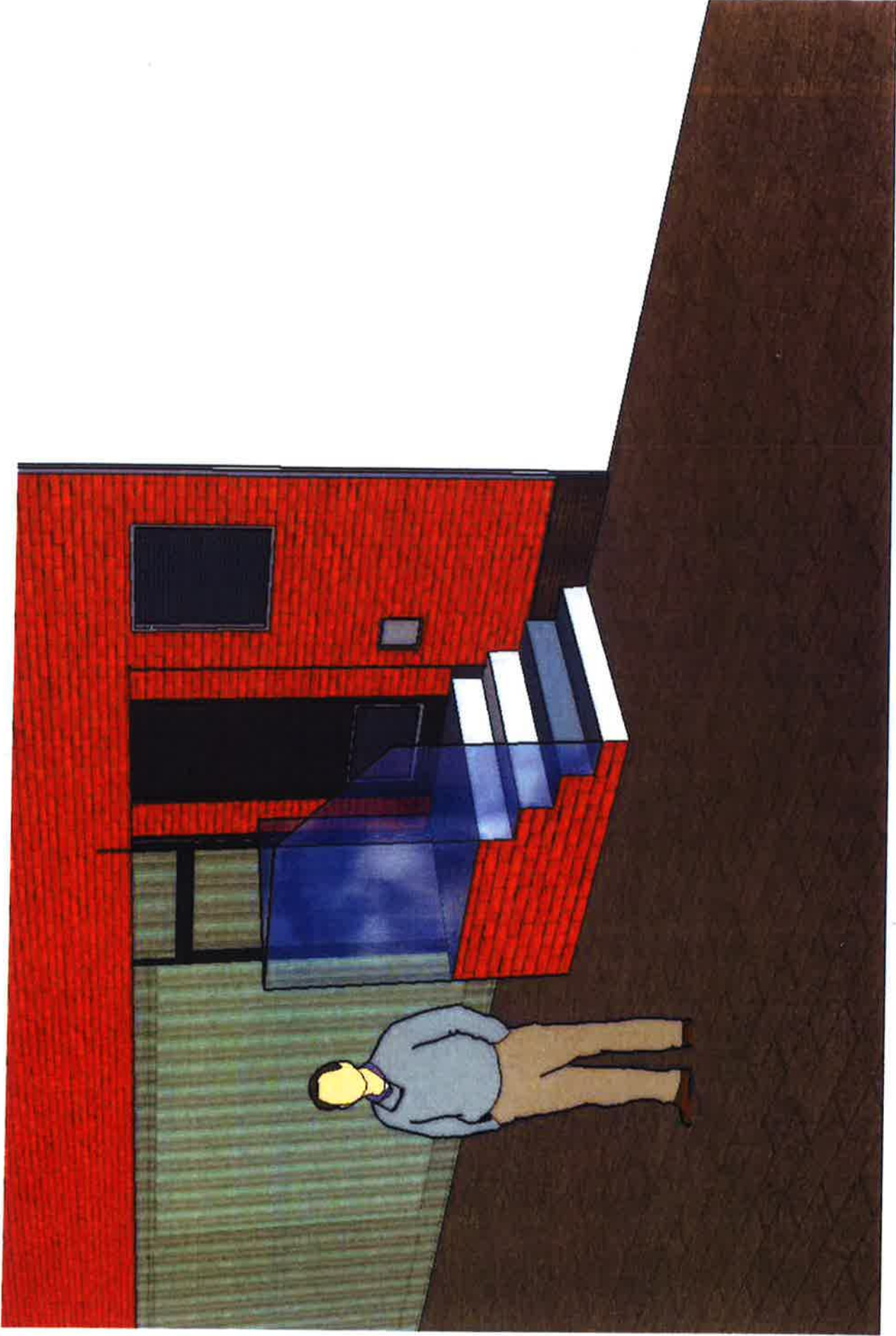
TBB FOOD CONCEPT srl CABINE HT 160 Kva