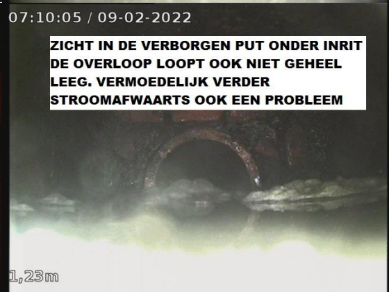
ZICHT IN DE VERBORGEN PUT ONDER INRIT DE OVERLOOP LOOPT OOK NIET GEHEEL LEEG. VERMOEDELIIK VERDER STROOMAFWAARTS OOK EEN PROBLEEM