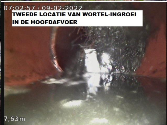
07:02:57 / 09-02-2022 TWEDE LOCATIE VAN WORTEL-INGROEI IN DE HOOFDAFVOER