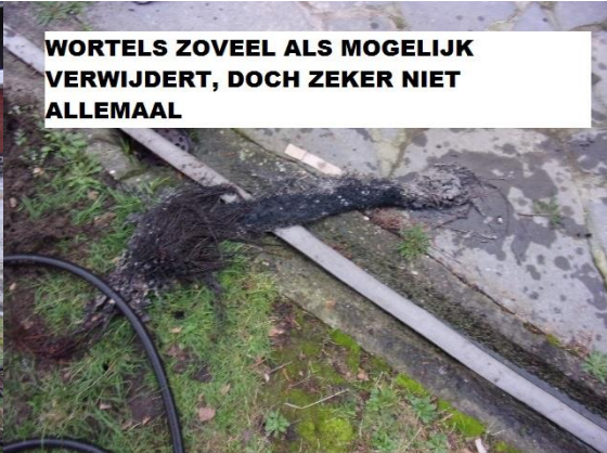
WORTELS ZOVEEL ALS MOGELIJK VERWIJDERT, DOCH ZEKER NIET ALLEMAAL