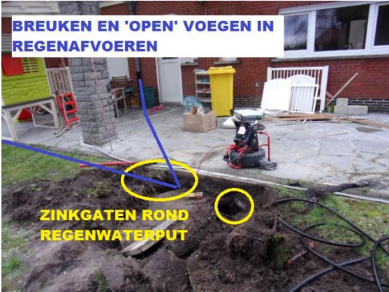
BREUKEN EN 'OPEN' VOEGEN IN REGENAFVOEREN