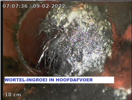
WORTEL-INGROEI IN HOOFDAFVOER