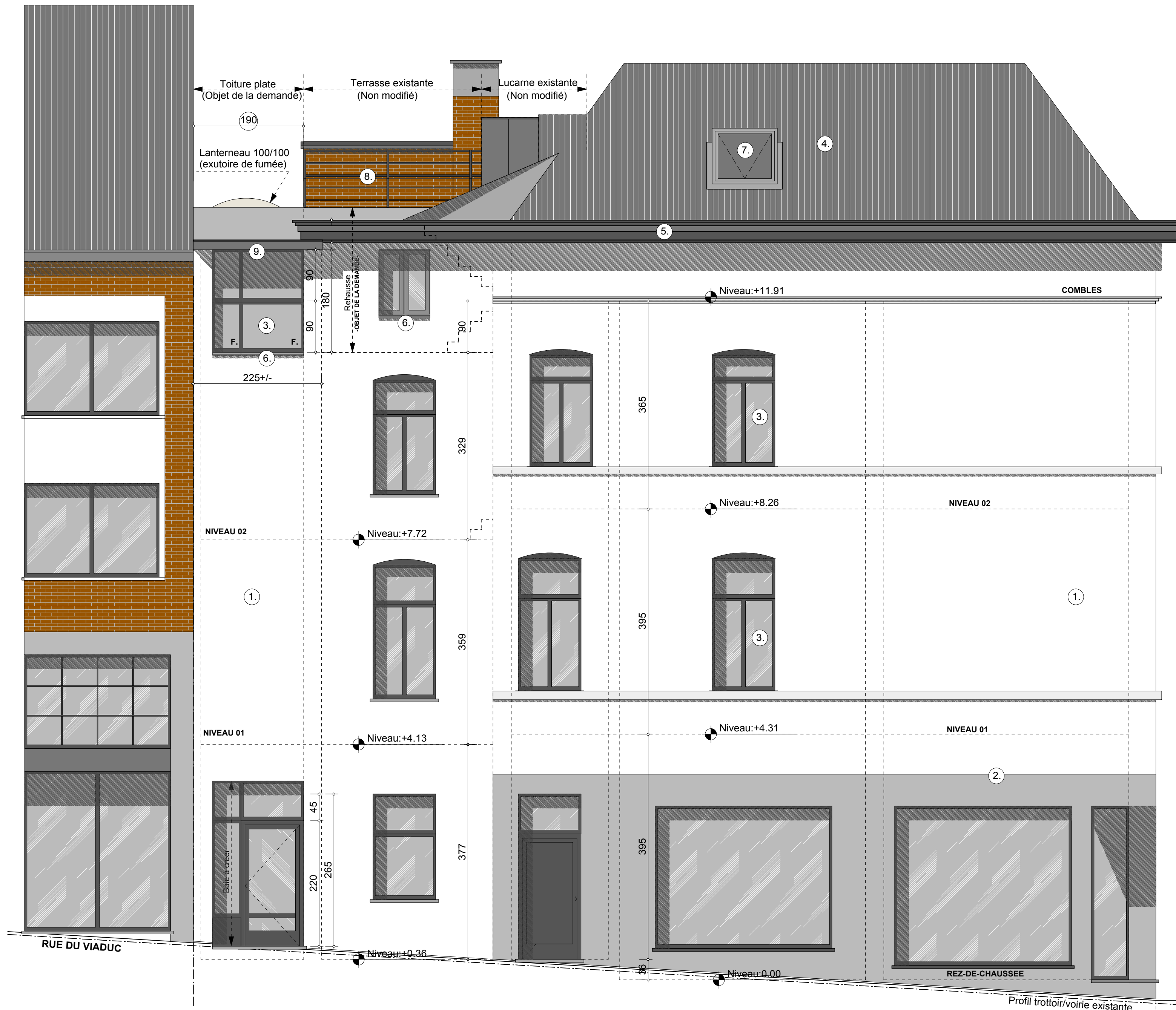
ELEVATION NORD-OUEST RUE DU VIADUC Situation projetée