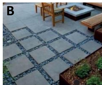
Terrace: 3,1 x 2,6 → 8,0 m 2