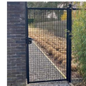
Porte → 5