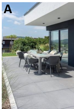
Terrace: 8,2 x 3,6 → 29,5 m 2