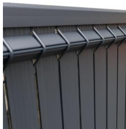
Cloture avec occultant → 1 & 3