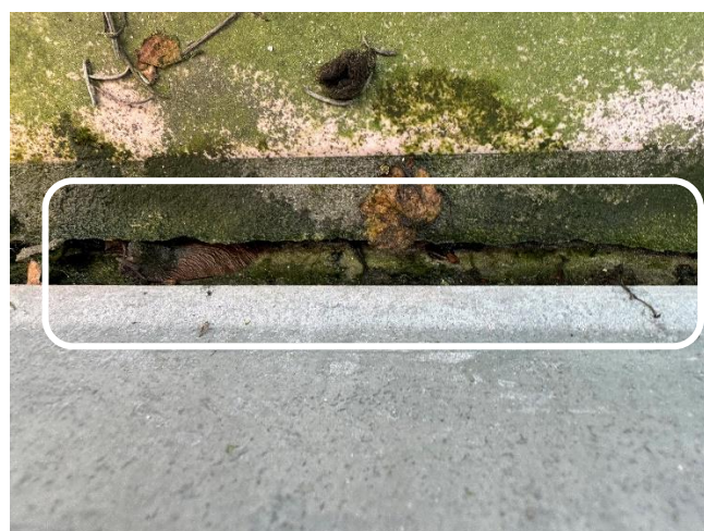
Plante dans l'évacuation et fissure dans le joint de ciment au bas du garde fous