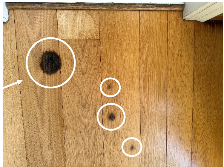
Taches noirâtres et humide dans le sol et sur le mur de la SAM