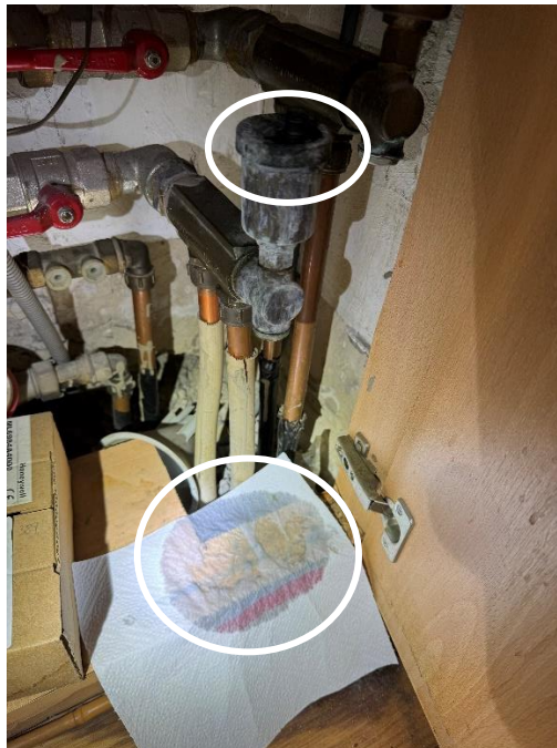
Compteur et vannes sur les circuits de chauffage – coulées depuis le purgeur de gauche