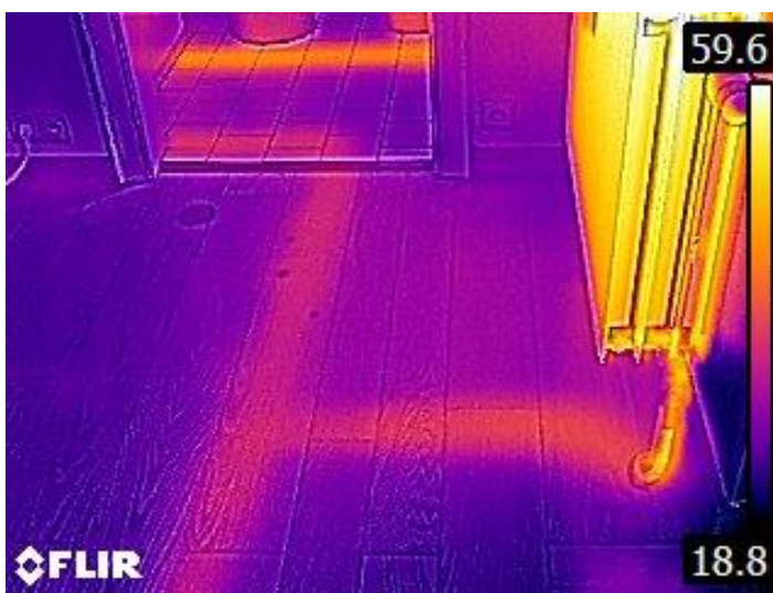
Rayonnement de chaleur normal dans le sol de la SAM