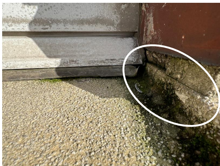
Joint de silicone déchiré – joint de ciment fissuré au bas du chassis de fenêtre