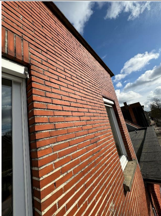
Joint de ciment fissuré autour du seuil de fenêtre - façade