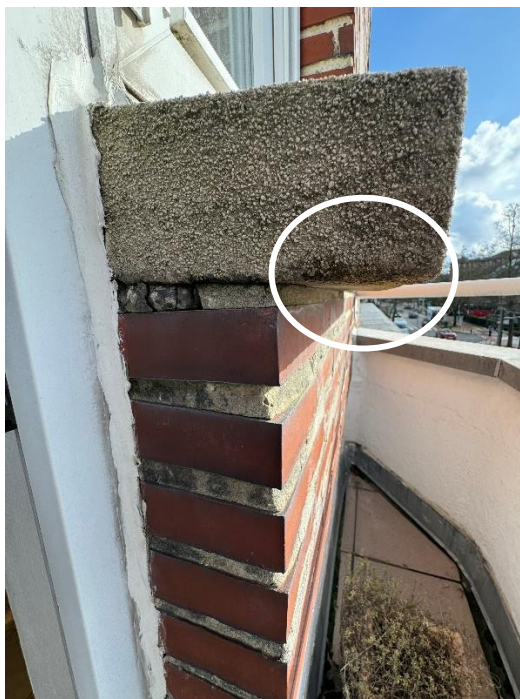
Absence de casse gouttes sous le seuil droit