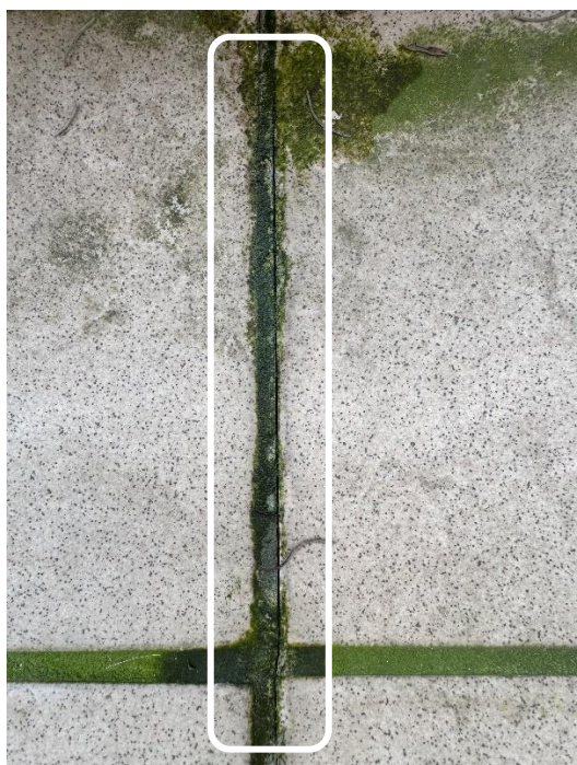
Joint de ciment fissuré entre les carrelages de sol